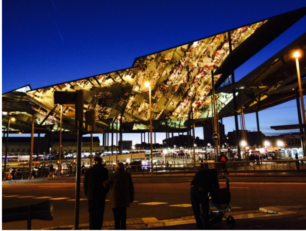
Mercat dels Encants