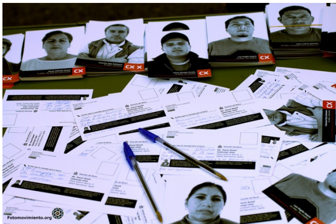
Enmedio. No somos números (Una acción contra los desahucios) 2013

Aquest grup d' artistes ens ofereixen un recorregut visual pels abusos financers més rellevants dels últims anys i les estratègies creatives que han ideat com forma de resistència. Art, disseny i fotografia com forma d'acció directa. www.enmedio.info